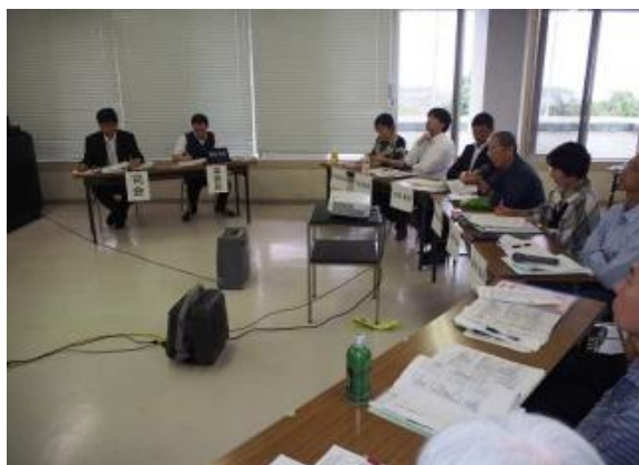
町民活動推進委員による審査風景