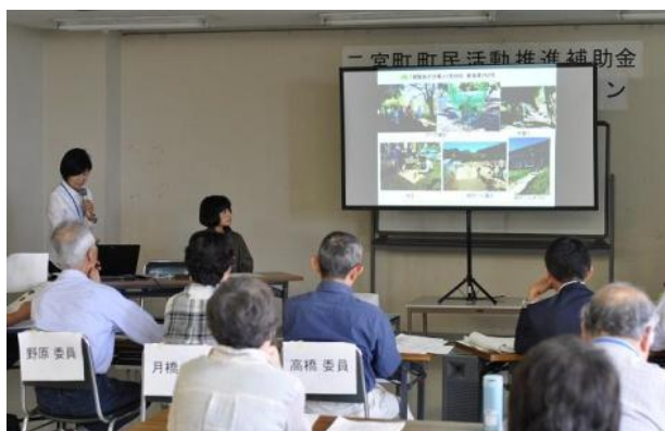
にのみや子ども自然塾